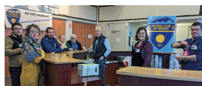
Des membres du CA lors de la soirée du 17 février

Nous avons la volonté de former des dirigeants et des arbitres au sein de notre club afin de gagner en compétences et de toujours évoluer.