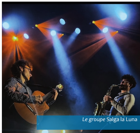
Le groupe Salga la Luna

Le CA de l'Amicale Laïque de Marsac sur Don