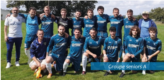
Groupe seniors A

Côté compétition , l'équipe seniors A a gagné le 1 er match de Coupe de France le 25 août dernier contre Sympho Treillères.