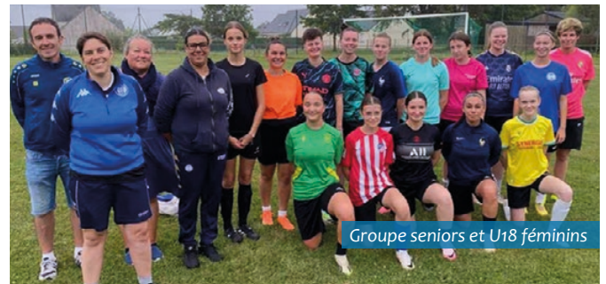
Groupe seniors et U18 féminins

Pour plus d'informations, n'hésitez pas à nous contacter par mail fcvaymarsac@gmail.com